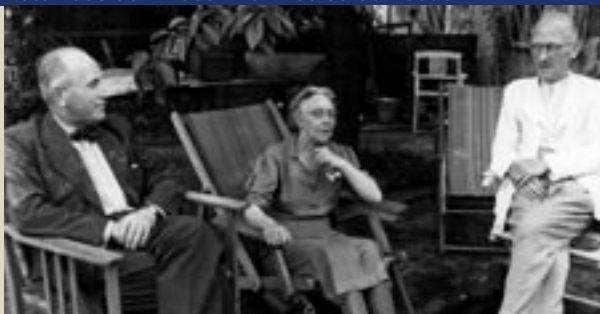
Louise Schroeder mit Bürgermeister Dr. Ferdinand Friedensburg (li.), 1947

Verleihung des Verdienstkreuzes mit Stern des Verdienstordens der Bundesrepublik Deutschland an die ehemalige Oberbürgermeisterin von Berlin, Louise Schroeder, durch den Bundespräsidenten, Dr. Theodor Heuss, 1952