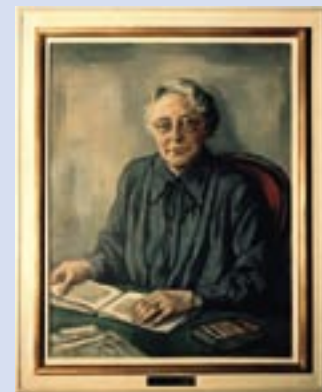
Gemälde von Heinrich Heuser in der Ehrenbürgergalerie im Abgeordnetenhaus von Berlin

Auch Sie sind gefragt, Vorschläge zur Nominierung herausragender Persönlichkeiten oder Institutionen einzureichen. Dem Vorschlag ist eine ausführliche Begründung sowie eine Biografie der vorgeschlagenen Person bzw. eine Beschreibung der vorgeschlagenen Institution beizufügen.