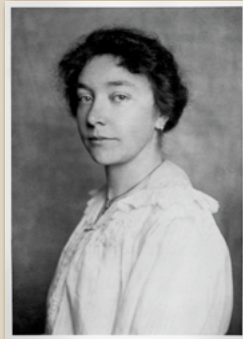
Die Reichstagsabgeordnete Louise Schroeder, 1920

Sie war maßgeblich beteiligt an der Gründung der Arbeiterwohlfahrt im Jahr 1919, dozierte ab 1925 an der Schule der Arbeiterwohlfahrt und unterrichtete als Dozentin am sozialpolitischen Seminar der Deutschen Hochschule für Politik in Berlin.