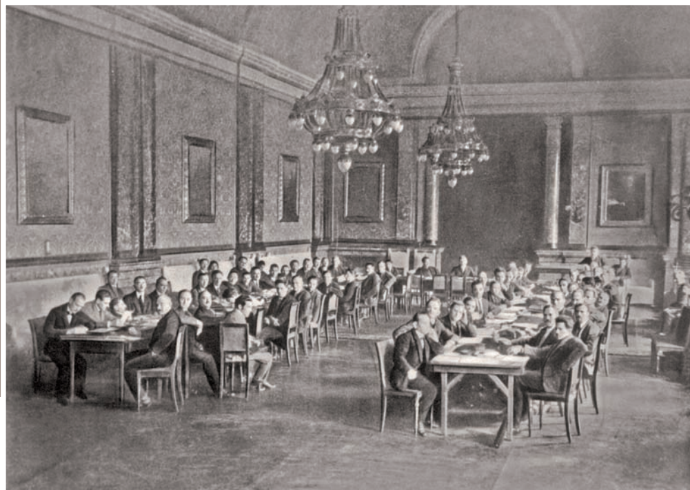
Festsaal um 1920