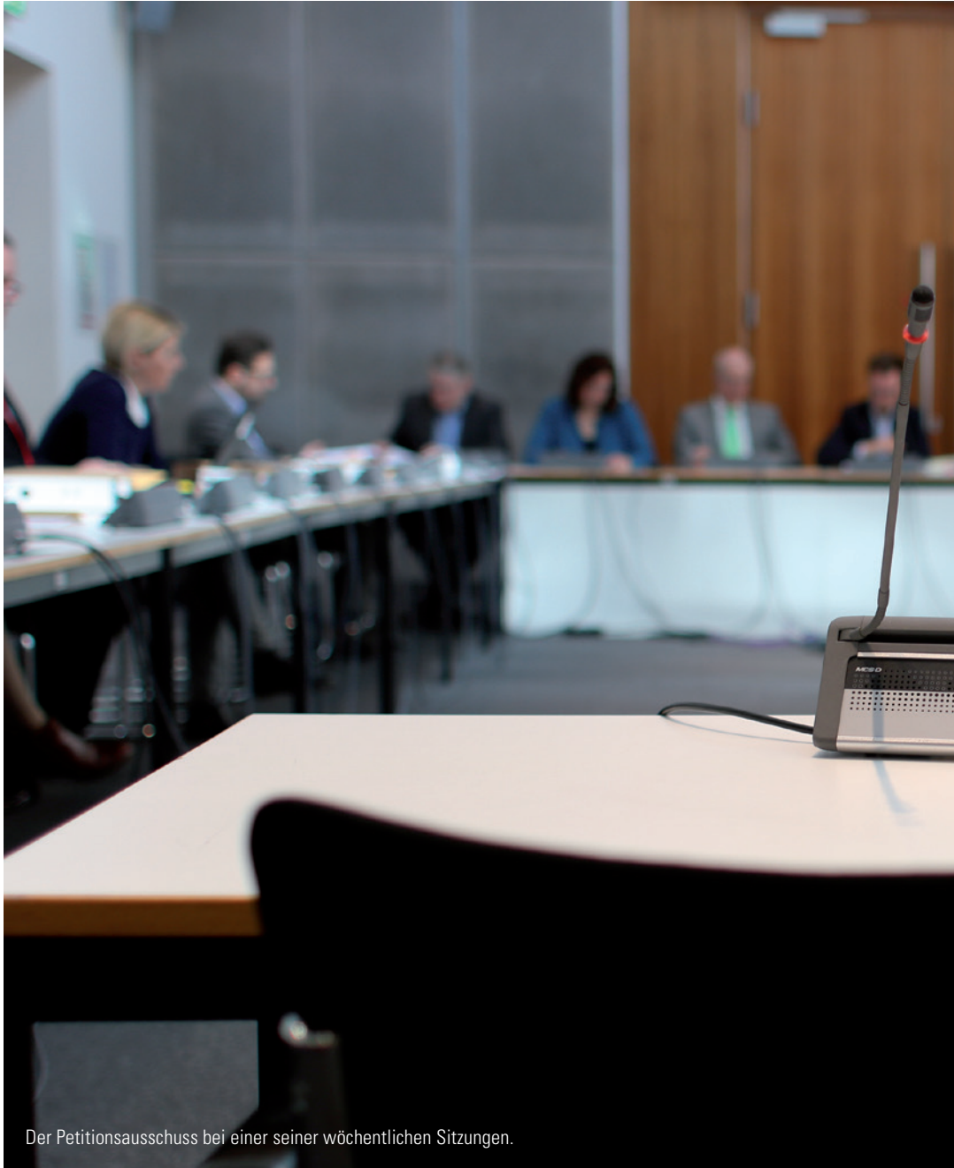
Der Petitionsausschuss bei einer seiner wöchentlichen Sitzungen.