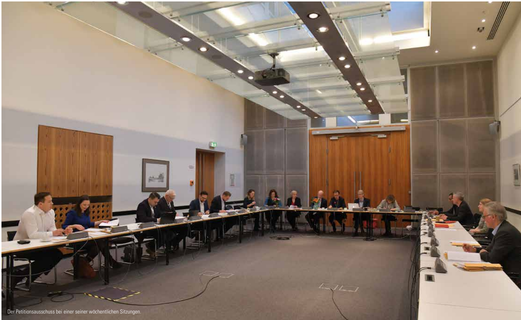
Der Petitionsausschuss bei einer seiner wöchentlichen Sitzungen.